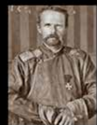
Р. фон Унгерн